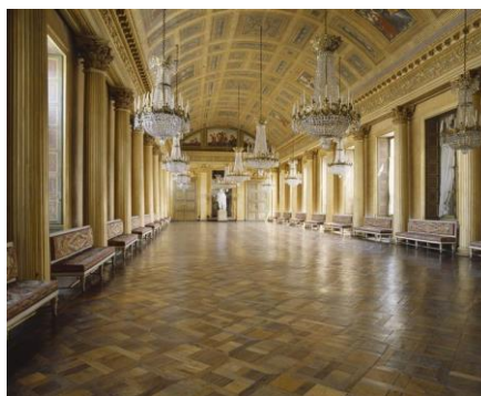
La Galerie de Bal